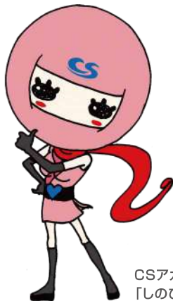
CSアカウンティング公認キャラクター 「しのびちゃん」