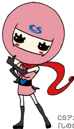
CSアカウンティング公認キャラクター 「しのびちゃん」