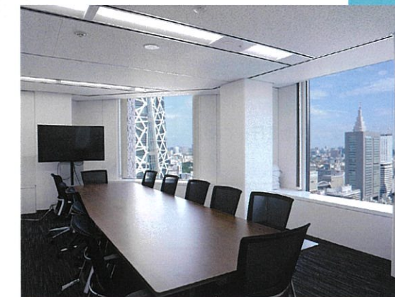
▲ オフィスは新宿駅の近くで通勤しやすい立地。

研修やOJTといったバックアップ制度はもちろん、業務時間外にも法改正やお客様のケーススタディの発表会などを開催するなど、学びや勉強を深める機会がたくさん。定期購読の補助、書籍自由購入制度など福利厚生も用意。入社してから社会保険労務士や税理士の資格を取る社員もいて、資格の報奨金制度も充実させています。社員に求めているのは、みずから学び行動・成長する「自律」の姿勢です。また、誠実さを軸に、謙虚で良識のある社会人であり続けられる人も重視しています。何より、企業だと異動により経理・人事の仕事から離れる可能性もありますが、弊社ではそうしたことはありません。この仕事に磨きをかけ極めたい、そんな人に適した職場と言えます。